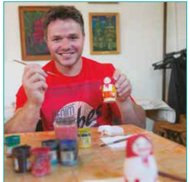
CONOCEMOS TAMBIÉN COMO SE FABRICAN Y PINTAN LAS FAMOSAS MARIUSKAS. LE ANIMAREMOS A QUE APRENDA A PINTARLAS