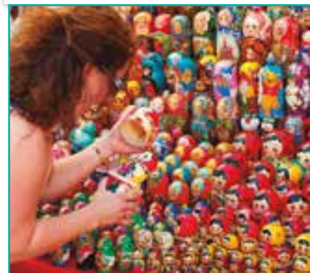
FÁBRICA DE MATRIUSKAS EN SERGEI POSAD

Servicios Generales de Europamundo: Recorrido en autocar con guía de habla hispana, seguro básico de viaje, desayuno tipo buffet y maletero, (1 maleta por persona) en los hoteles con este servicio. Traslado de salida Excursión: Pushkin con entrada al Palacio de Catalina en San Petersburgo, Kolomenskoye (Ceremonia tradicional bodas rusas) en Moscú. Visita Panorámica en: Berlín, Copenhague (Opción 2, 3), Estocolmo, Helsinki, Tallin, San Petersburgo, Novgorod, Tver, Suzdal, Moscú. Entradas: Palacio de Catalina, Fortaleza de Pedro y Pablo; Museo Hermitage en San Petersburgo, Kremlin; Museo Arquitectura de Madera en Novgorod, Monasterio en Valday, Monasterio de la Trinidad; Fábrica de Matriuskas en Sergei Posad, Kremlin; Catedral Monasterio de San Eufanio; Museo Arquitectura de Madera en Suzdal, Kremlin en Moscú. Ferry: Dinamarca - Suecia (Opción 2, 3), Suecia-Finlandia, Helsinki - Tallin, Alemania-Dinamarca (Opción 2). 5 Almuerzos o Cenas Incluidos en: Novgorod, Tver, Sergei Posad, Suzdal, Suzdal.