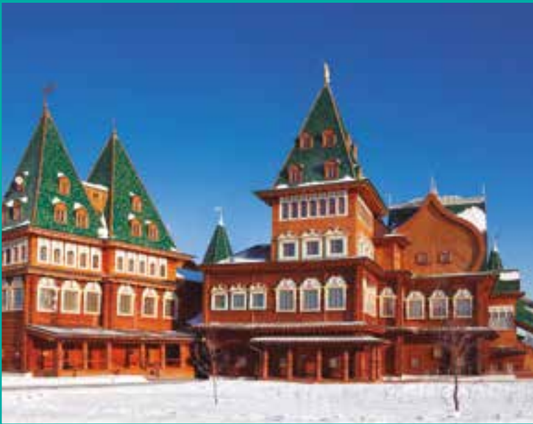
MOSCÚ. INCLUIMOS UNA EXCURSIÓN A KOLOMENSKOYE.