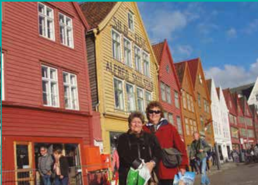
BERGEN FOTOGRAFIA: MARISA YABRAN