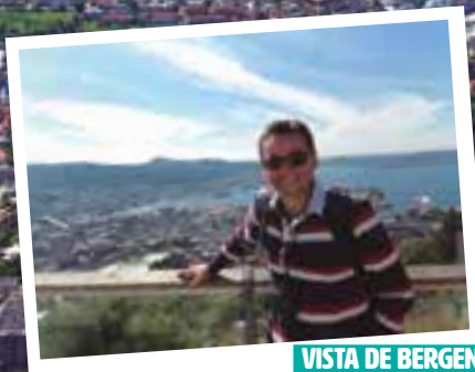
VISTA DE BERGEN FOTOGRAFÍA: LUIZ ZERBINI