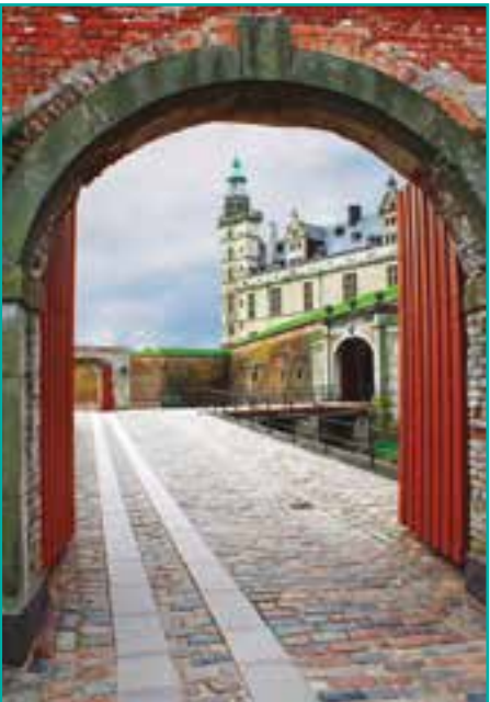
ENTRADA AL CASTILLO DE KRONBORG

Incluimos una visita panorámica en la capital de Finlandia, la presencia del mar, su antiguo mercado, la influencia rusa en sus edificios e iglesias. Fin de nuestros servicios.