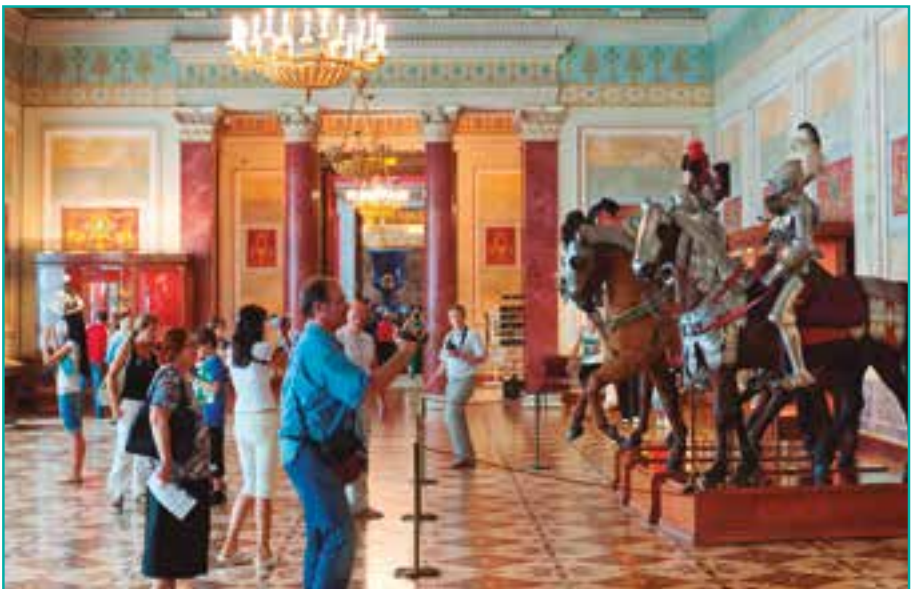
SAN PETERSBURGO. MUSEO DEL HERMITAGE. UN FANTÁSTICO

Traslado al aeropuerto y fin de nuestros servicios.