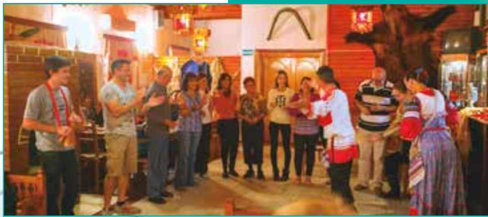
SUZDAL CENA INCLUIDA. DURANTE LA CENA UN GRUPO FOLCLÓRICO NOS AMENIZARÁ LA VELADA, AL SON DE LAS BALALAIKAS