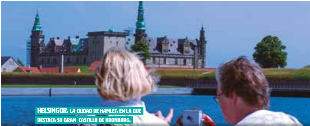
HELSINGOR. LA CIUDAD DE HAMLET. EN LA QUE DESTACA SU GRAN CASTILLO DE KRONBORG.

Servicios Generales de Europamundo : Recorrido en autocar con guía de habla hispana, seguro básico de viaje, desayuno tipo buffet y maletero, en los hoteles con este servicio. Visita Panorámica en: Estocolmo, Copenhague. Ferry: Suecia - Dinamarca