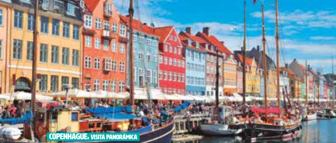
COPENHAGUE. VISITA PANORÁMICA