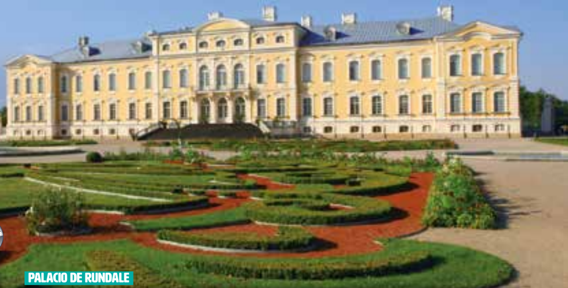
PALACIO DE RUNDALE